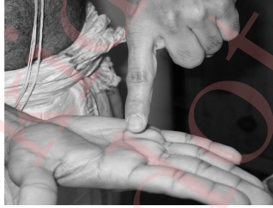
Figure 5: Scribing on your right palm with the left index finger.

Either imagine the word यं written on your right palm or scribe the word यं, in the script you are comfortable with, on your right palm with your left index finger, as shown in Figure 5.