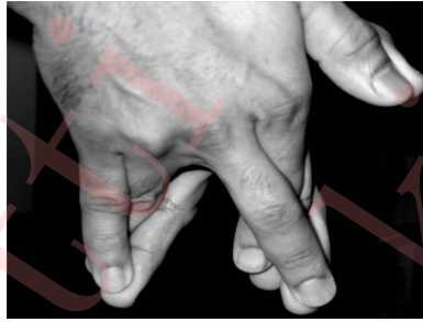
Figure 7: Configuring सुरभि मुद्रा with the right hand.

Configure the सुरभि मुद्रा with your hands as shown in Figure 7. This is done by touching your left little and right ring fingers, left ring and right little fingers, left index and right middle fingers, and left middle and right index fingers.