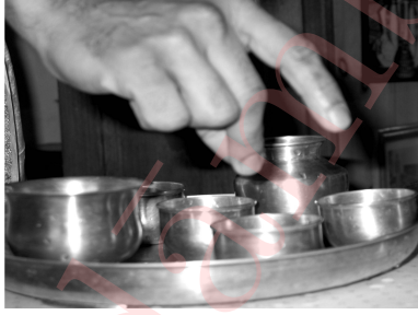
Figure 8: Snapping above the vessel.

The procedure of doing शोषणं, दाहनम् and प्लावनम् to the IUC, followed by showing the सुरभि मुद्रा to the IUC and subsequently performing the अस्त्रमन्त्रम् over the IUC will be referred to as performing