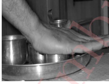
Figure 3: Covering the vessel with your right palm.

Cover पाद्य पात्रम् (vessel no. 3) with your right palm and recite