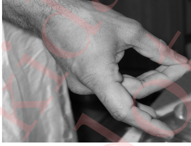
Figure 4: Configuring ग्रासमुद्रा with your right hand

Ring the घण्टा with your left hand and configure ग्रासमुद्रा with your right hand, as shown in Figure 4. This is done by holding the thumb, middle and ring fingers together and leaving the index and little fingers free. Now move the right hand with this configuration from the cooked