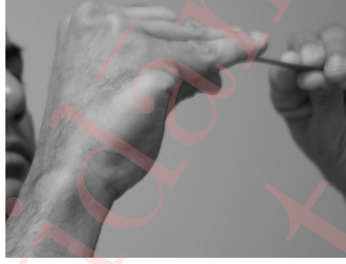
Figure 2: Covering an उद्धरिणि of water from पूर्णकुम्भम्.

and pour this water back into the पूर्णकुम्भम् (vessel no. 1).