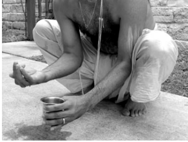
Figure 2: ആചമനം.

Sit in the കൂക്കുടാനുന posture with hands between the legs, as shown in Fig. 2.