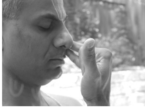
Part 1 ರೇಚಕ

In the third part, keep the left nostril closed with the ring finger and exhale through the right nostril. Say ಓಂ and touch the right ear. Figure 3 shows the three parts of ಪ್ರಾಣಾಯಾಮಂ.