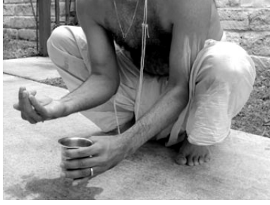
Figure 2: ಆಚಮನಂ.

Sit in the ಕುಕ್ಕುಟಾಸನ posture with hands between the legs, as shown in Fig. 2.