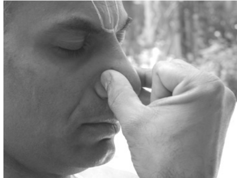
Part 3 ಕುಂಭಕ