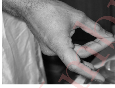
Figure 4: Configuring ಗ್ರಾಸಮುದ್ರಾ with your right hand