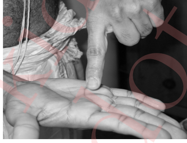
Figure 5: Scribing on your right palm with the left index finger.

Either imagine the word ಯಂ written on your right palm or scribe the word ಯಂ, in the script you are comfortable with, on your right palm with your left index finger, as shown in Figure 5.