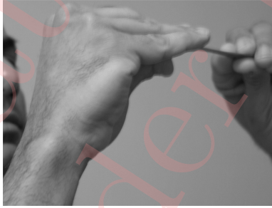
Figure 2: Covering an ಉದ್ಧರಿಣಿ of water from ಪೂರ್ಣಕುಂಭಂ.

and pour this water back into the ಪೂರ್ಣಕುಂಭಂ (vessel no. 1).