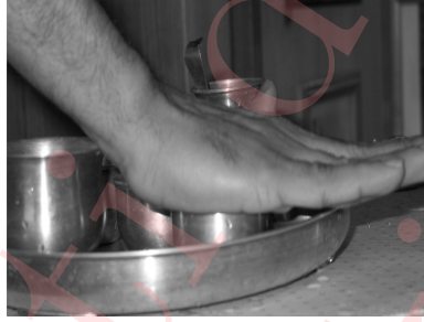
Figure 3: Covering the vessel with your right palm.

17. Cover ಅರ್ಘ್ಯ ಪಾತ್ರಂ (vessel no. 2) with your right palm, as shown in Figure 3, and recite