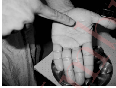
Figure 6: Scribing on your left palm with the right index finger.